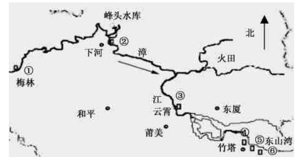
图 1 沿漳江取样地点分布图 FIGURE 1 Distribution of sample sites along the Zhangjiang River, Fujian Province

各样品清洗后,经 80℃烘干,磨粉后干燥保存待测.测定时每次取样 0.3 g,每个样品 2~3 次重复,同时用国家标准物质灌木枝叶 GB-W076033(含 Si(0.6±0.07)%)做对照,置于瓷坩埚中放入马福炉灰化后用 HF 溶解灰分 [16] ,用 Si 钼蓝分光光度法测定 [17] .用该方法测定国家标准灌木枝叶 GB-W076033 中 Si 含量为 0.503%±0.015%,回收率